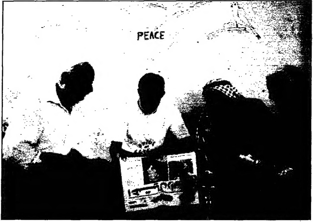
صورة من معرض فونوغرافي فلسطيني في إطار تظاهرة للربيع الفلسطيني في باريس